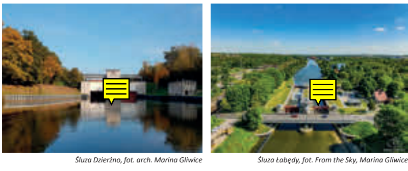
Szluz Dzierżno, fot. arch. Marina Gliwice Szluz Łabędź, fot. From the Sky, Marina Gliwice Szluz Rudziniec, fot. From the Sky, Marina Gliwice

Szlak kajakowy na Kanaale Gliwickim jest malowniczy i ciekawy, pomimo jego spokojnego charakteru i leniwego biegu wody. Brzozy kanału są zarostem, dookoła słychać ptasi śpiew i widać wyskakujące ponad taflę wody ryby. Płynięcie kanałem daje wiele ciekawych opcji tworzenia różnych kompozycji tras kajakowych, nawet kilkudniowych. Obsługa szluz jest życzliwa i pomocna dla kajakarzy. W czasie płynięcia można spotkać łodzie motorowe oraz statki pasażerskie. Zbudowany w dwudziestolecu międzywojennym kanał Gliwicki, jest unikatowym nowoczesnym kanałem śródlądowym, ma więc swoje wyjątkowe w skal kraju atrakcje hydrotechniczne. Największą atrakcją jest z pewnością pokonywanie szluz. Jednym z największych obiektów hydrotechnicznych Kanału Gliwickiego jest Szluz Dzierżno, krótka woda. Zbudowana wraz z kanałem w 1939 r. została oddana do użytku dopiero w 1941 r. po częściowej przebudowie konstrukcji. Jest ogromną szluzą, której dwie bliźniacze komory o długości 71 m i szerokości 12 m, zamykane są z górnej strony ruchomym progiem, z dolnej zaś podnoszoną bramą. Różnica poziomów między górną i dolną wodą wynosi 10,3 m. Identyczną budowę ma Szluz Kłodnica, znajdująca się na końcu Kanału Gliwickiego. Szluz Łabędź (4,2 m piętrzenia) oraz bliźniacze szluz: Rudziniec, Sławice i Nowa Wieś (6,25 m piętrzenia) mają nieco inną konstrukcję, bowiem bliźniacze komory zamykane są uchylnymi wrotami.