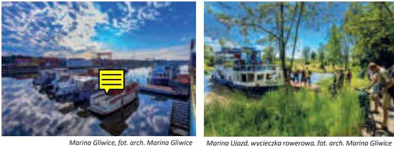
Marina Gliwice, fot. arch. Marina Gliwice Ujeździe, wycieczka rowerowa, fot. arch. Marina Gliwice Pławniowice, fot. arch. Marina Gliwice

Marina Gliwice – przystań motorowodna oraz kajakowa na Kanaale Gliwickim. Działa tu wypozyczalnia łodzi motorowych i kajaków, z tego miejsca startują statki pasażerskie. Organizowane są przyrodnicze rejsy statkiem przez szluz do pobliskiej kolonii kormoranów, rejsy turystyczne do Pałacu w Pławniowicach, rowerowe do Ujeźdu, tematyczne: muzyczne, kulinarne, literackie, a także połączone z biesiadą. Można tu zostawić samochód na czas spływu oraz skorzystać z serwisu sprzętu, czy miejsca do grillowania.