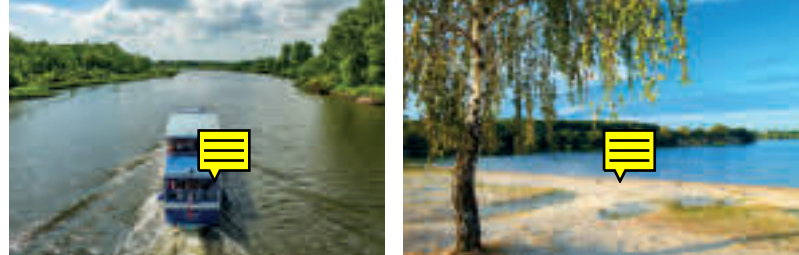
Rejs statkiem po Kanaale Gliwickim, fot. From the Sky, Marina Gliwice Jezioro Pławniowice, fot. T. Renk, www.slaskie.travel

Przystań Leśna Pławniowice – przystań na prawym brzegu Kanału Gliwickiego. Miejsce cumowania statku pasażerskiego Tryton w latach 1962-1992. Jedną z pierwszych jednostek odbywających rejsy turystyczne po Kanaale Gliwickim. Można tutaj zaplanować odpoczynek w trakcie spływu oraz zorganizować piknik. Kilaset metrów od przystani znajduje się plaża nad jeziorem Pławniowice.